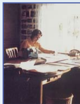
Kanzleibüro, Königstr. 25, ca. 1960