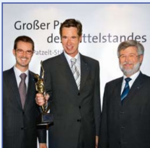
Preisverleihung "Großer Preis des Mittelstands", 2008