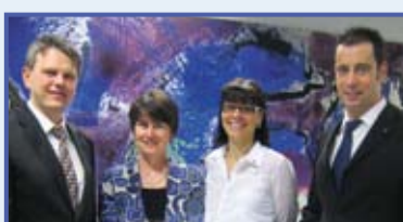
Mitarbeiter der Niederlassung Stuttgart

2009 Die Stuttgarter Niederlassung zieht in den Ortsteil Degerloch in die Löffelstraße 40 um. Die Einweihung wird mit der Ausstellung „Kunst in der Kanzlei“ verbunden.