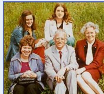
Mitarbeiterausflug, ca. 1970