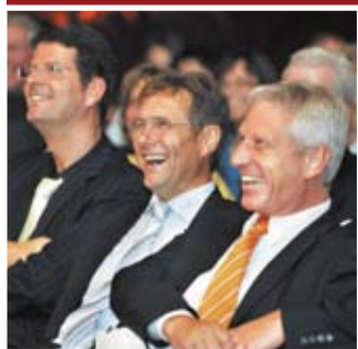
Begeisterung unter den Zuhörern