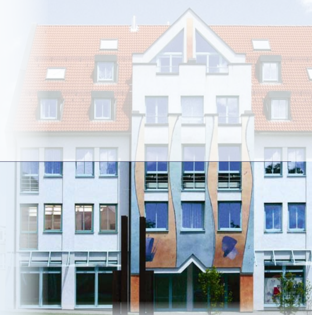
Kanzlei WSS, Königstr. 25, heute