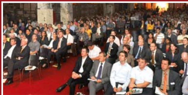
Die DENKANSTÖSSE treffen immer auf großes Interesse