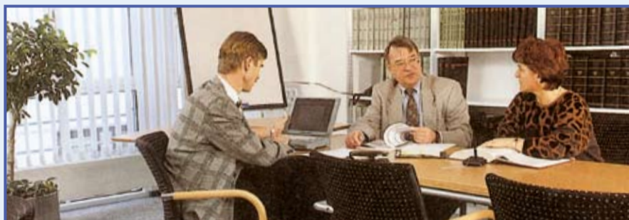
Interne Besprechung, 1999